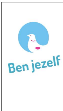
<< Begin beeld

De filmpjes bestaan uit een Begin – Midden – Eind. Begin en Eind zijn grafisch en (vrijwel) altijd hetzelfde, met eventueel wat kleine veranderingen maar over het geheel oogt het hetzelfde. Dit zodat het altijd herkenbaar is waar ze vandaan komen en bij deze Campagne horen.