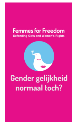
Eind beeld >>